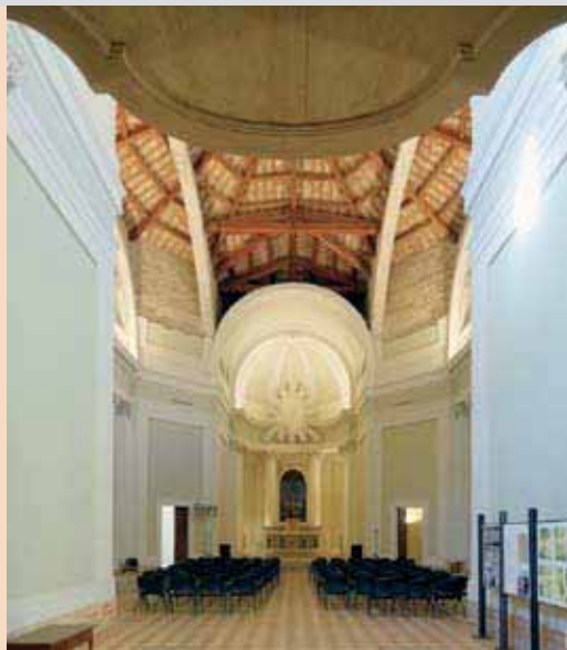
OFFAGNA Chiesa SS. Sacramento Sabato 3 ottobre, ore 10.00