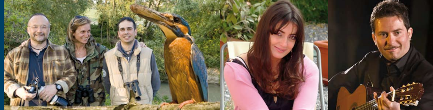
Istituto Campana per l'Istruzione Permanente / Incontri d'Autore